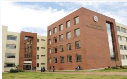
SEDE LATACUNGA - CAMPUS GRAL. GUILLERMO RODRÍGUEZ LARA