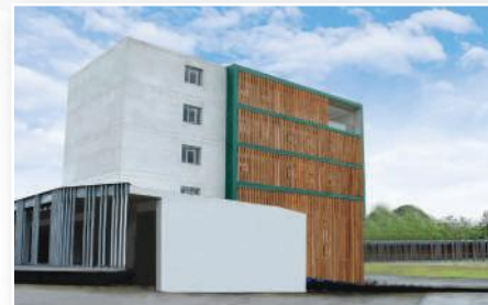
SEDE SANTO DOMINGO