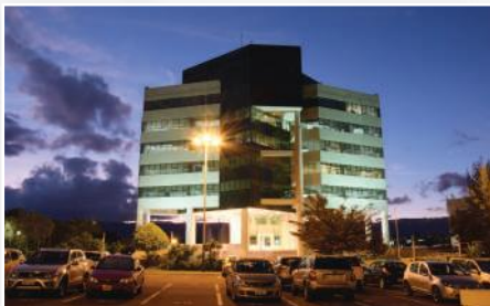
SEDE MATRIZ - SANGOLQUÍ